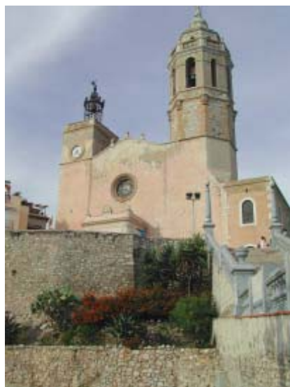
Església de Sitges

El litoral és el lloc més densament poblat del territori, cosa que ha originat una gran pressió de l'home sobre aquest medi. A partir d'una vila com Sitges es pot veure com el desenvolupament i el creixement de les ciutats modelen el seu medi.