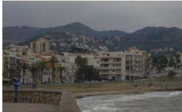
Vista des de la platja de Sant Sebastià

Amb l'expansió turística dels anys 60 les vessants de les muntanyes de les muntanyes del massís del Garraf són ocupades per les primeres urbanitzacions. La dècada dels 70, i finalment dels 80, consolida aquesta ocupació d'urbanitzacions marginals - sovint sense serveis bàsics mínims -, que fan desaparèixer del paisatge les antigues "xarmades" (terrasses de pedra seca en fortes pendents de la muntanya, on es conreava vinya).