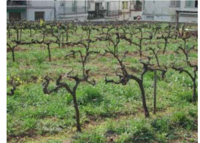
Vinya a Sitges

Domini de les pinedes de pi blanc i de les formacions arbustives com màquies litorals de garric i margalló.