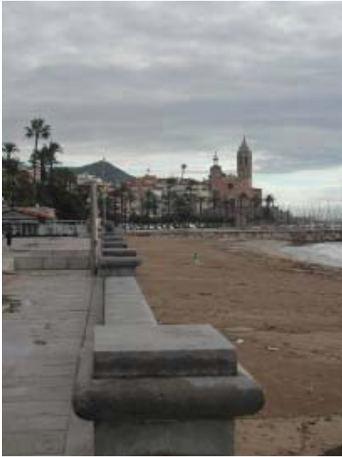
Platja de Sitges